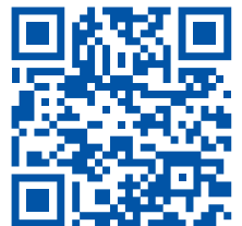
통학버스 운행 및 노선안내